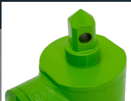
Vřeteno pohonu se středěním