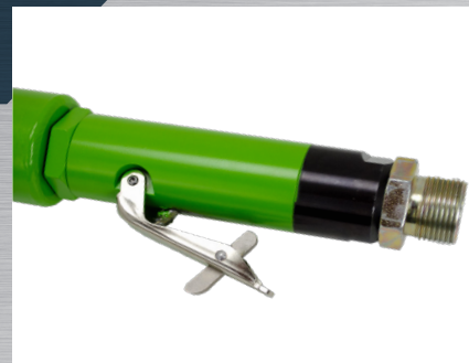
Bezpečnostní páčka nebo bezpečností otočná rukojeť