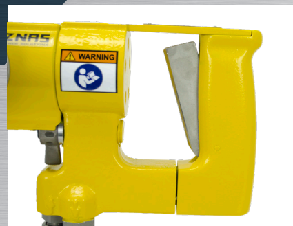
D-rukojeť nebo pistolové madlo