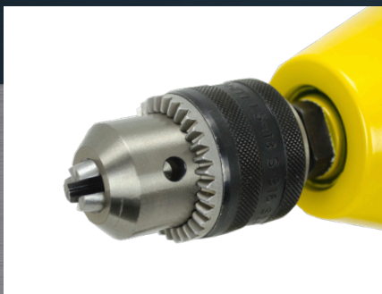
Zubové sklíčidlo do průměru 13 mm